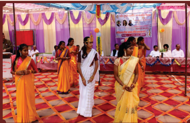
Students performing Saraswati vandana