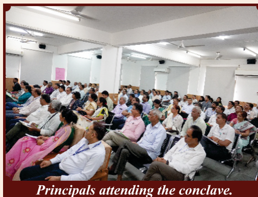
Principals attending the conclave.