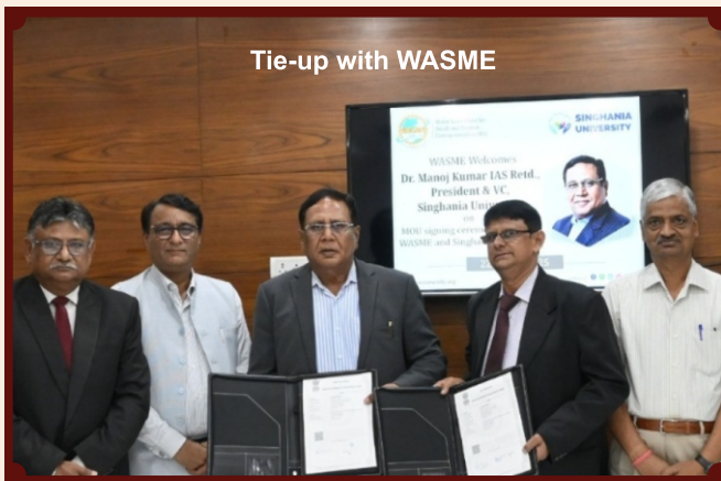
Tie-up with WASME