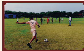
Students Playing Football in the Ground

Singhania School celebrated National Sports Day with great zeal and enthusiasm to mark the birth anniversary of hockey legend Major Dhyan Chand on August 29th. The day began with a special assembly highlighting the importance of sports and fitness in a student's life. Various sporting events and fun games were organized for different classes, where students showcased their talent, team spirit, and sportsmanship.