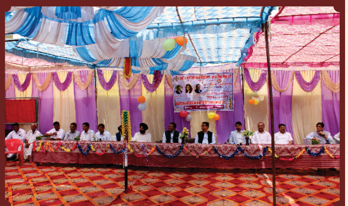
Guests in School Premises