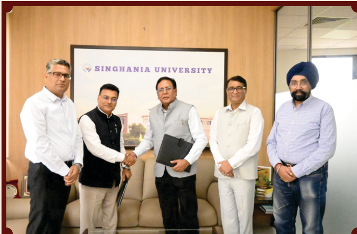
HANDSHAKE: MoU with SkillO

Singhania University signed up Memorandum of Understanding with Skills Oxygen LLP and industry- nurturing work-ready, world ready, and future-ready professionals.