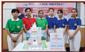
Students Displaying Their Models In The Competition